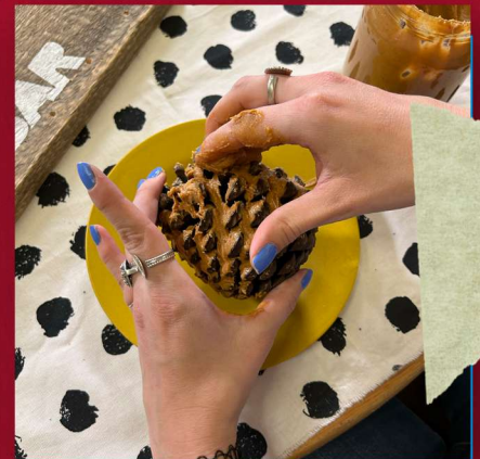
Besmeer de dennenappels met een laag pindakaas.