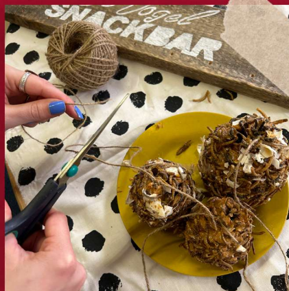
Hang touwtjes aan de dennenappels.