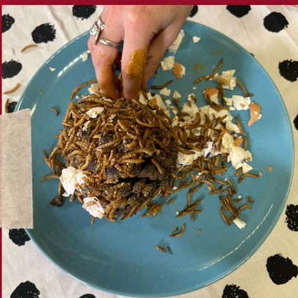
Rol de dennenappels door vogelzaad, meelwormen en/of eierschalen.