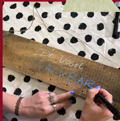
Schilder of teken de naam van je vogelsnackbar op de plank.