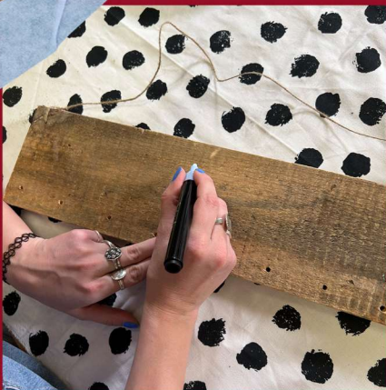
Rijg een touwtje door de twee gaatjes bovenaan de plank.